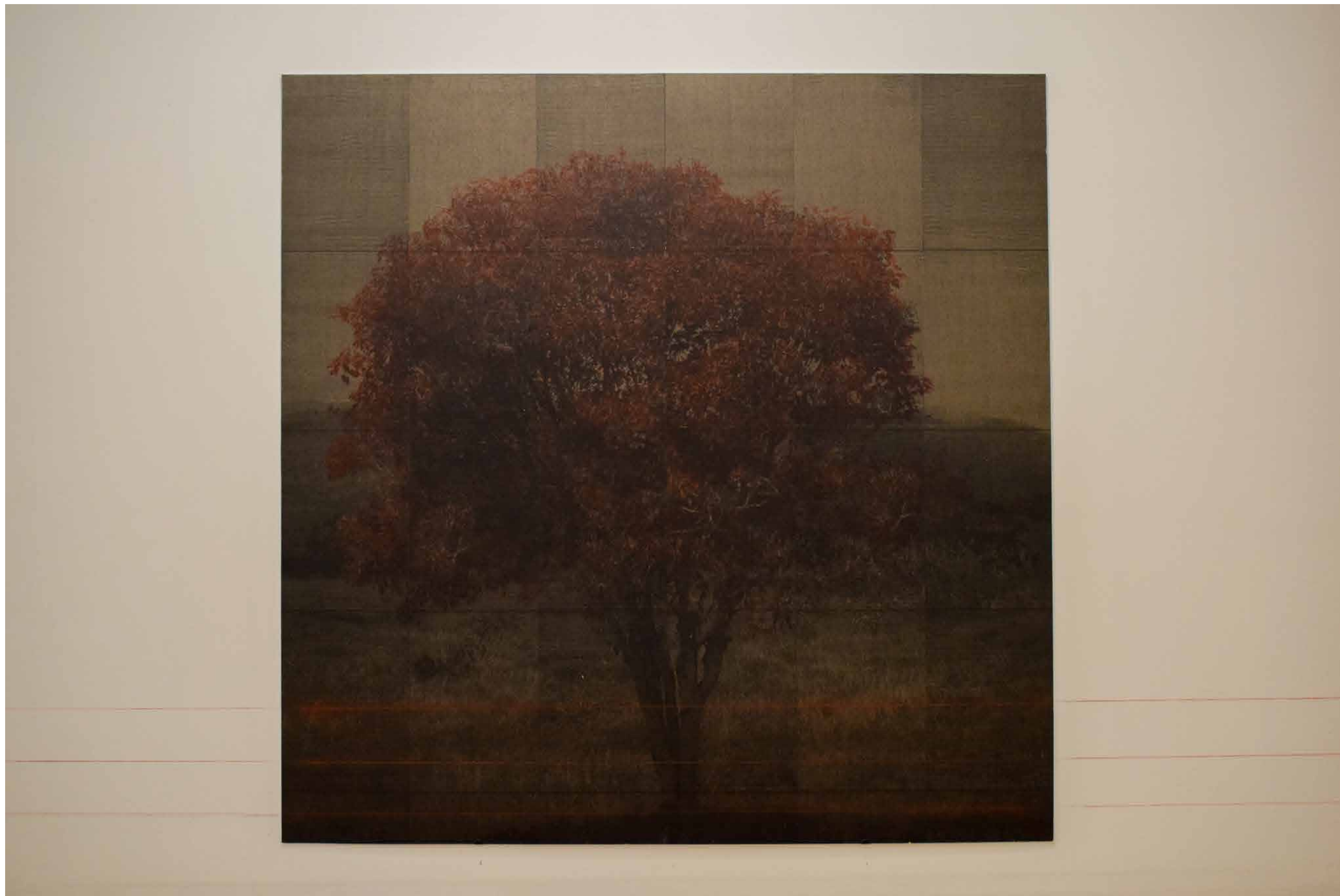
Marcar territorio, 2022 Mixed media 120 x 120 cm