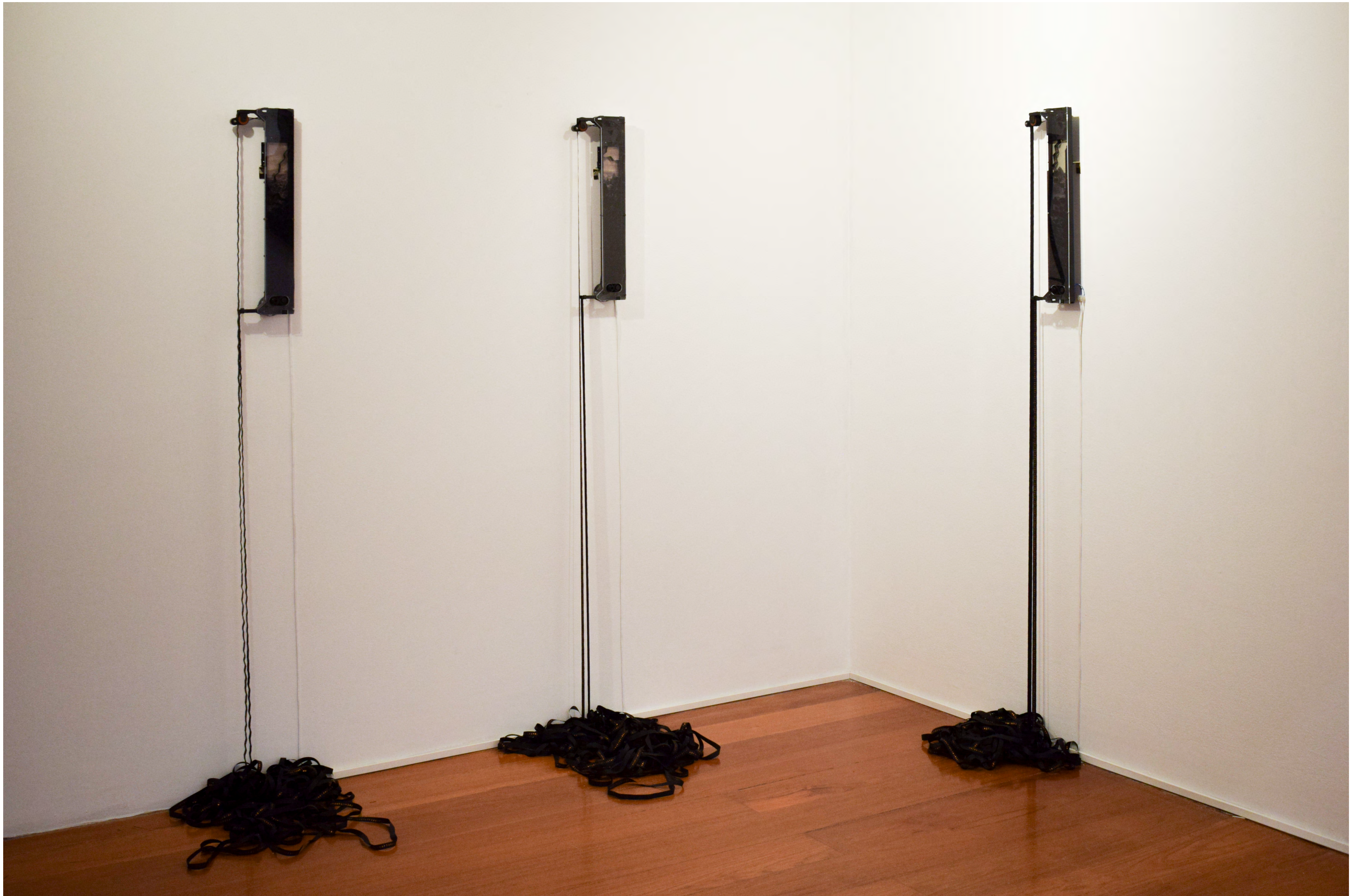
Maternar un paisaje Digital print, tape, mechanical system 51 x 4 cm 2022