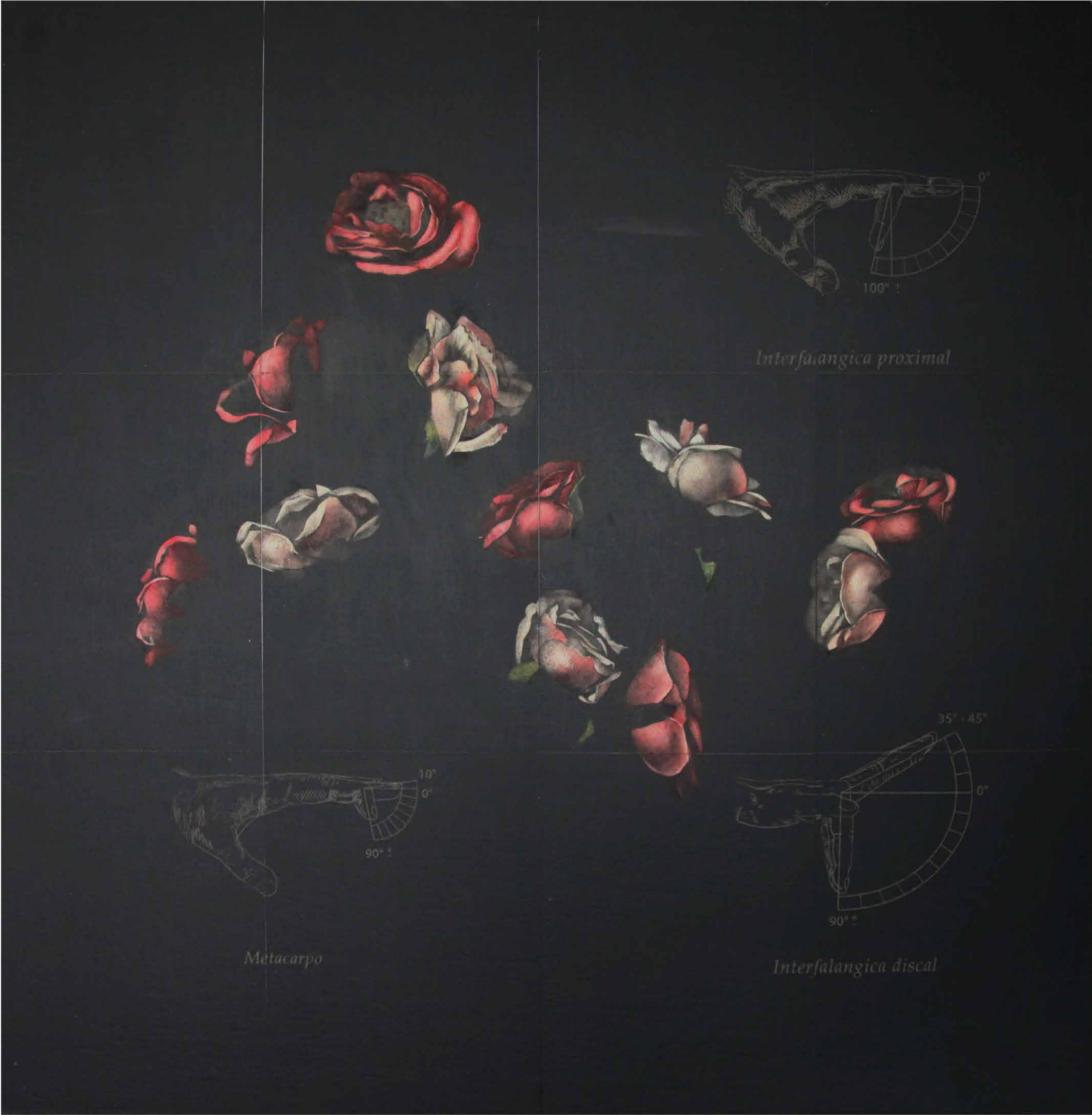
Parque humano VIII Oil on charcoal paper 80 cm x 83 cm 2020