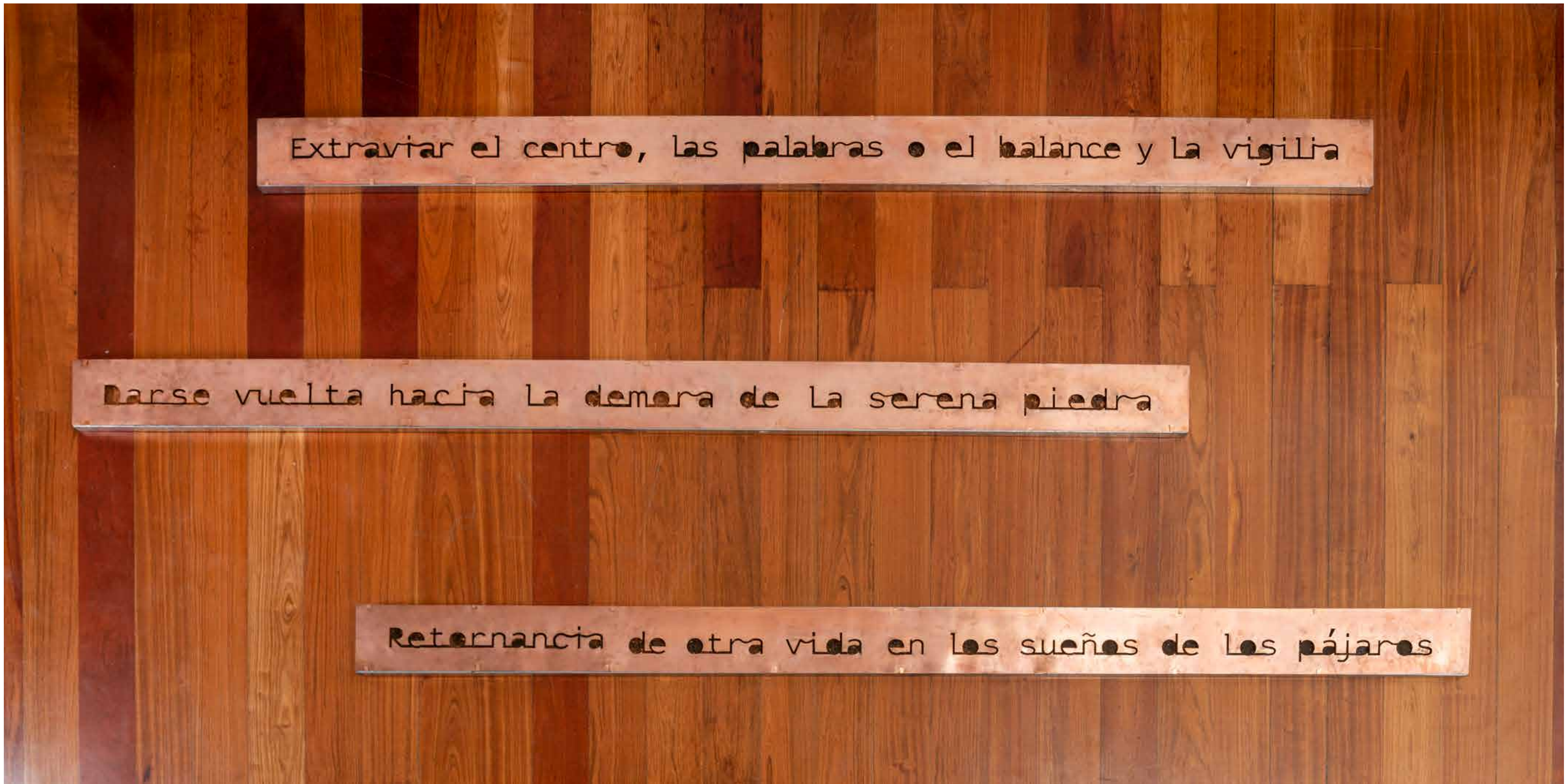
(Detail) Tomar suelo