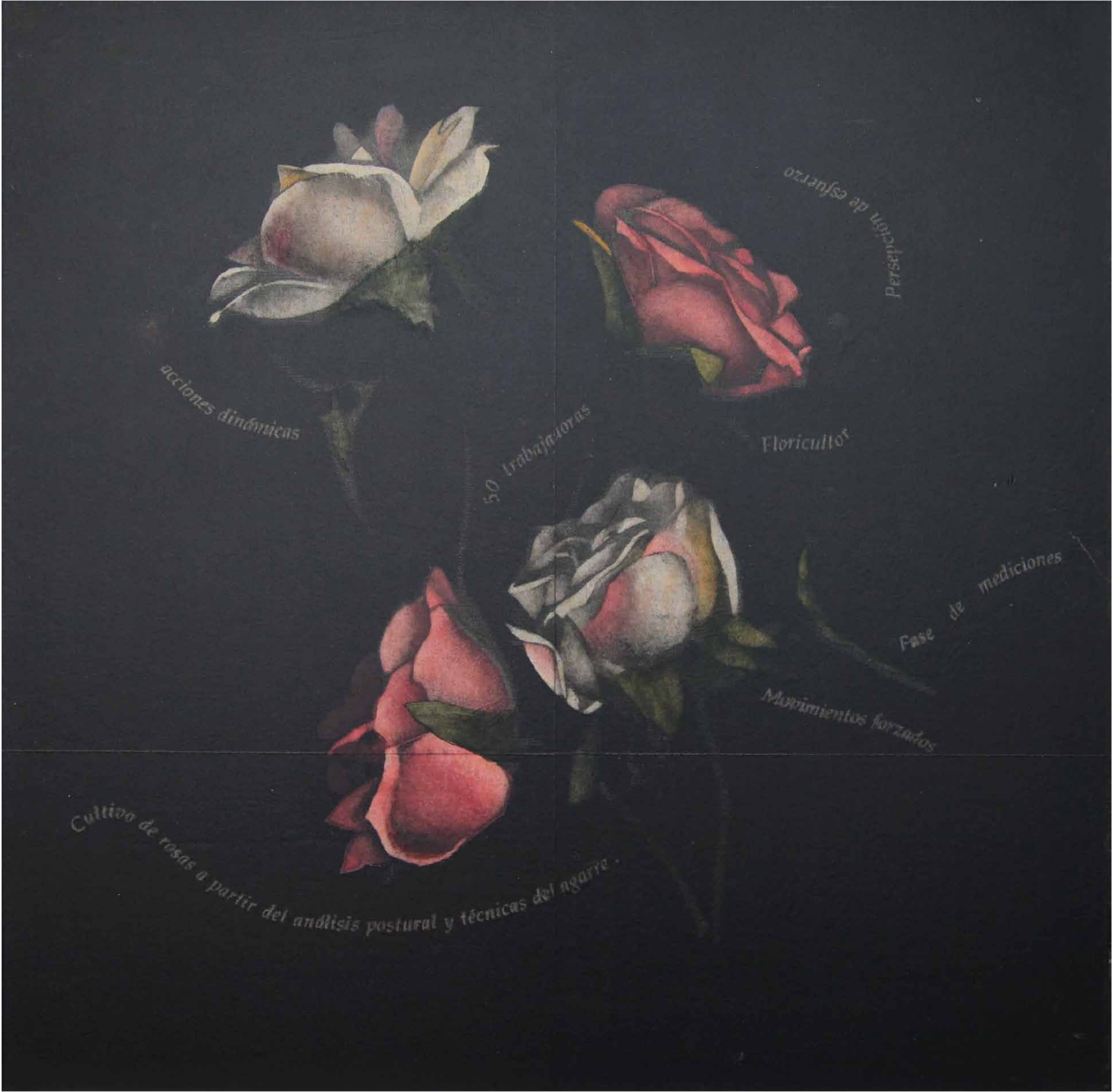
Parque humano V Oil on charcoal paper 80 cm x 83 cm 2020