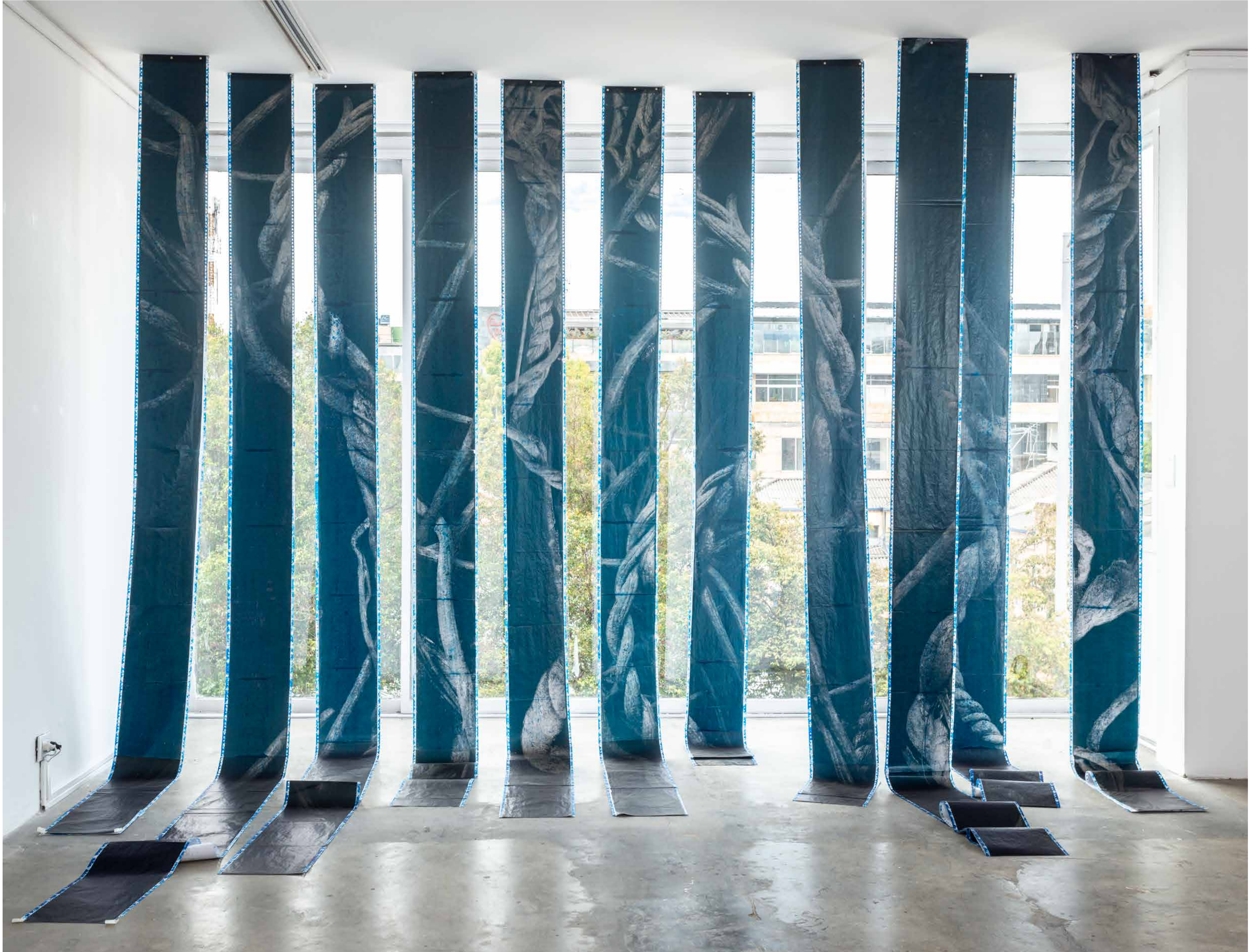
Cuerda de los espíritus Charcoal printed paper Variable dimensions