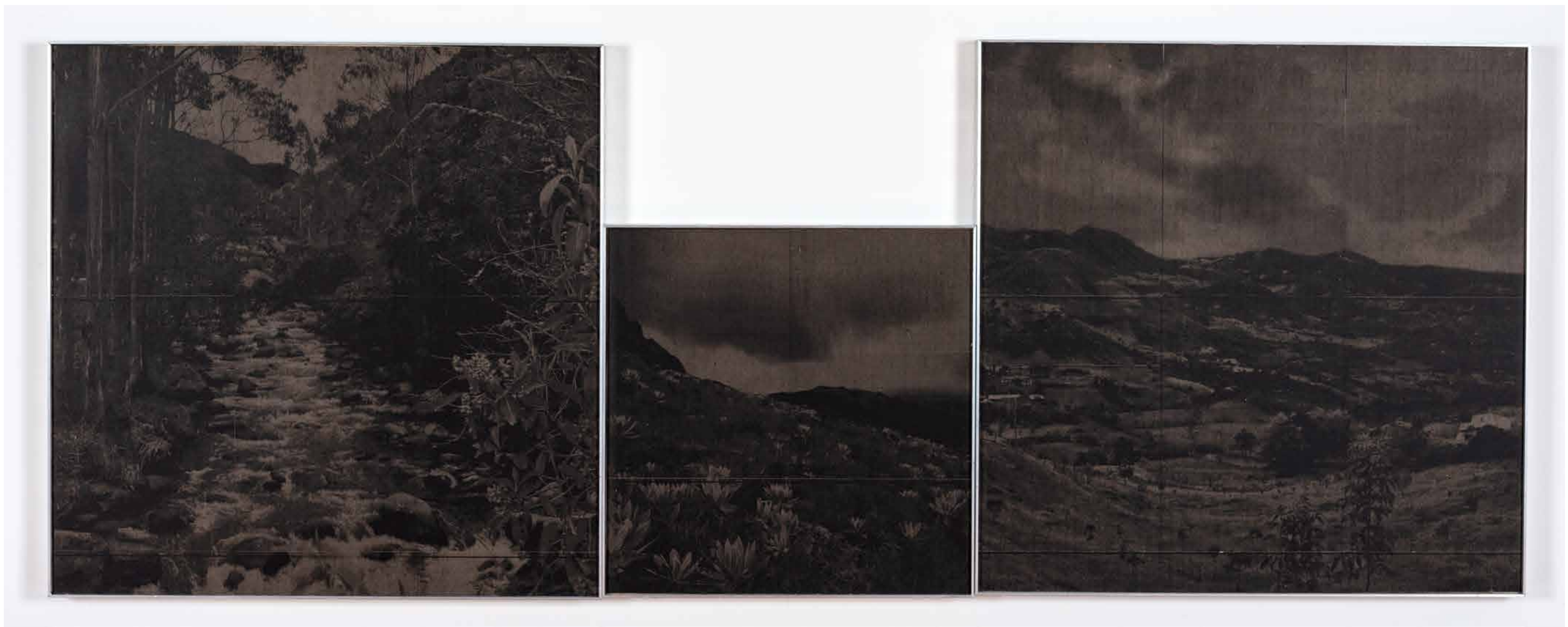
Tomar suelo Tryptich Charcoal printed paper Left: 80 x 80 cm | Center: 60 x 60cm | Right: 80 x 80cm