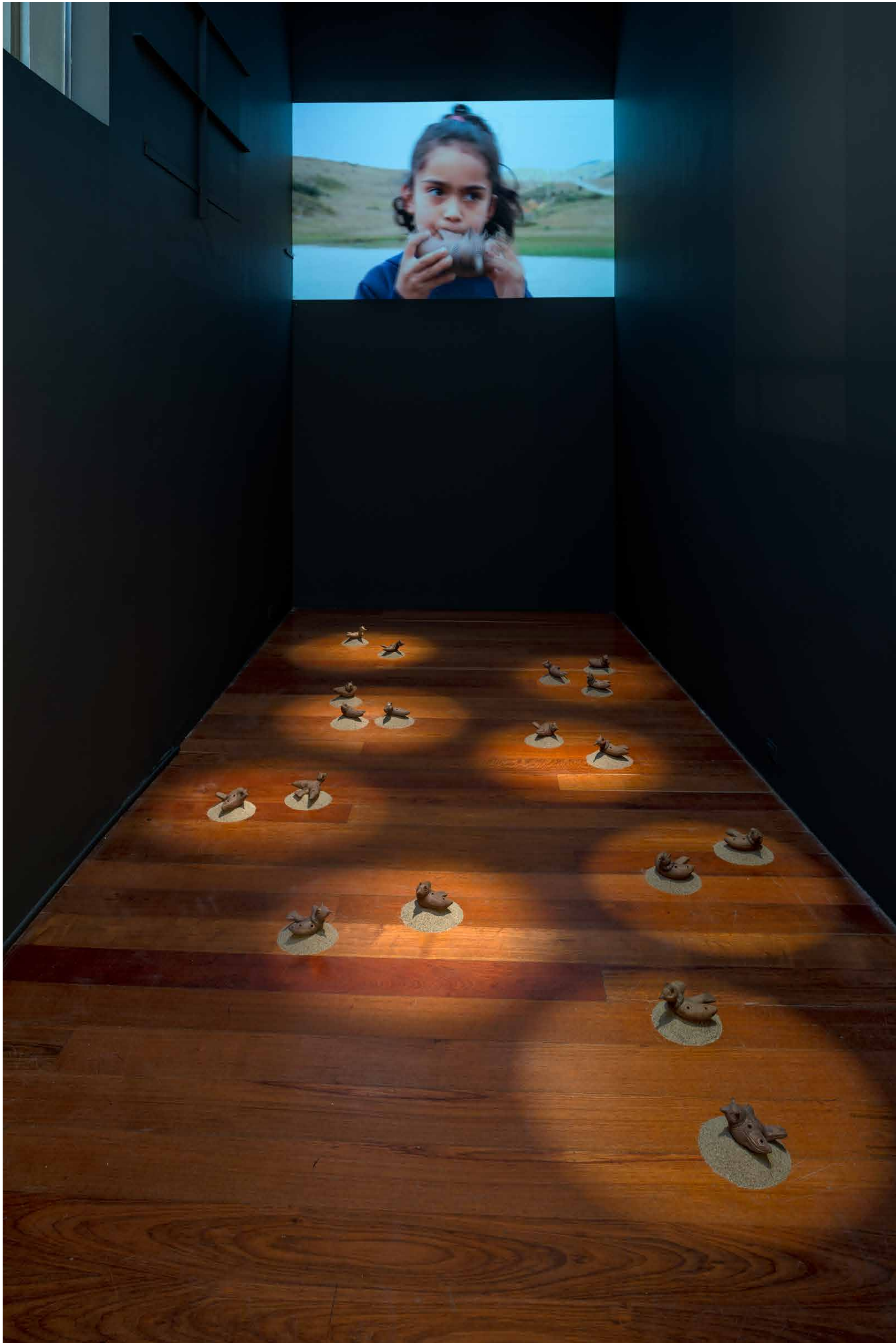
Las montañas mueven la fe Monochannel video and y ceramic birds 2022