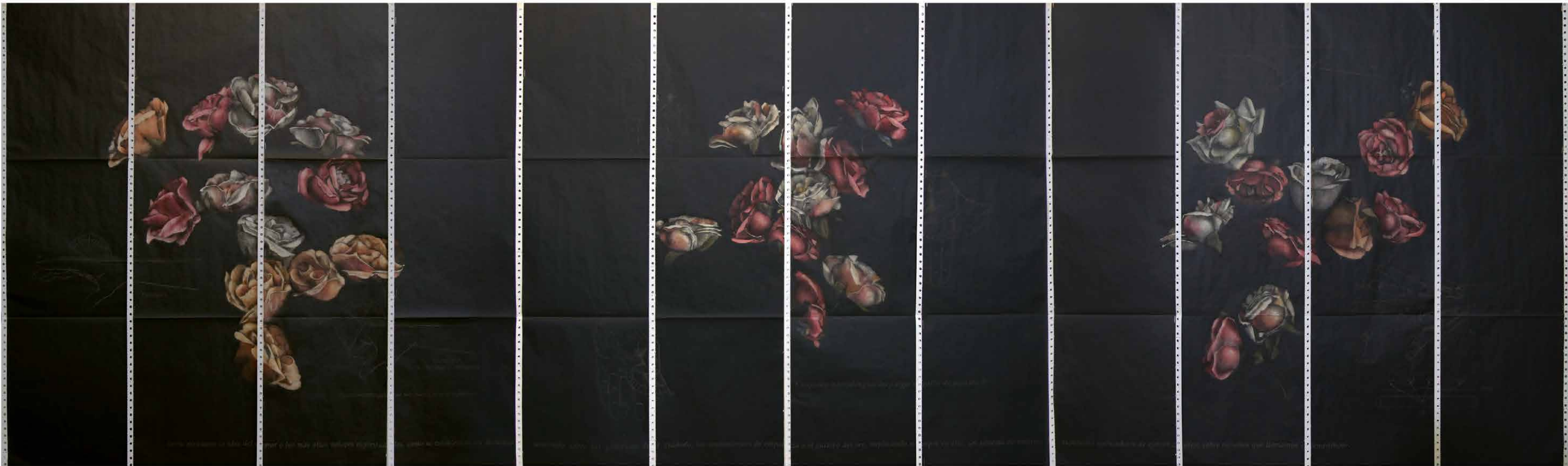
Parque humano Oil con Charcoal paper 80 cm x 274,8 cm 2021