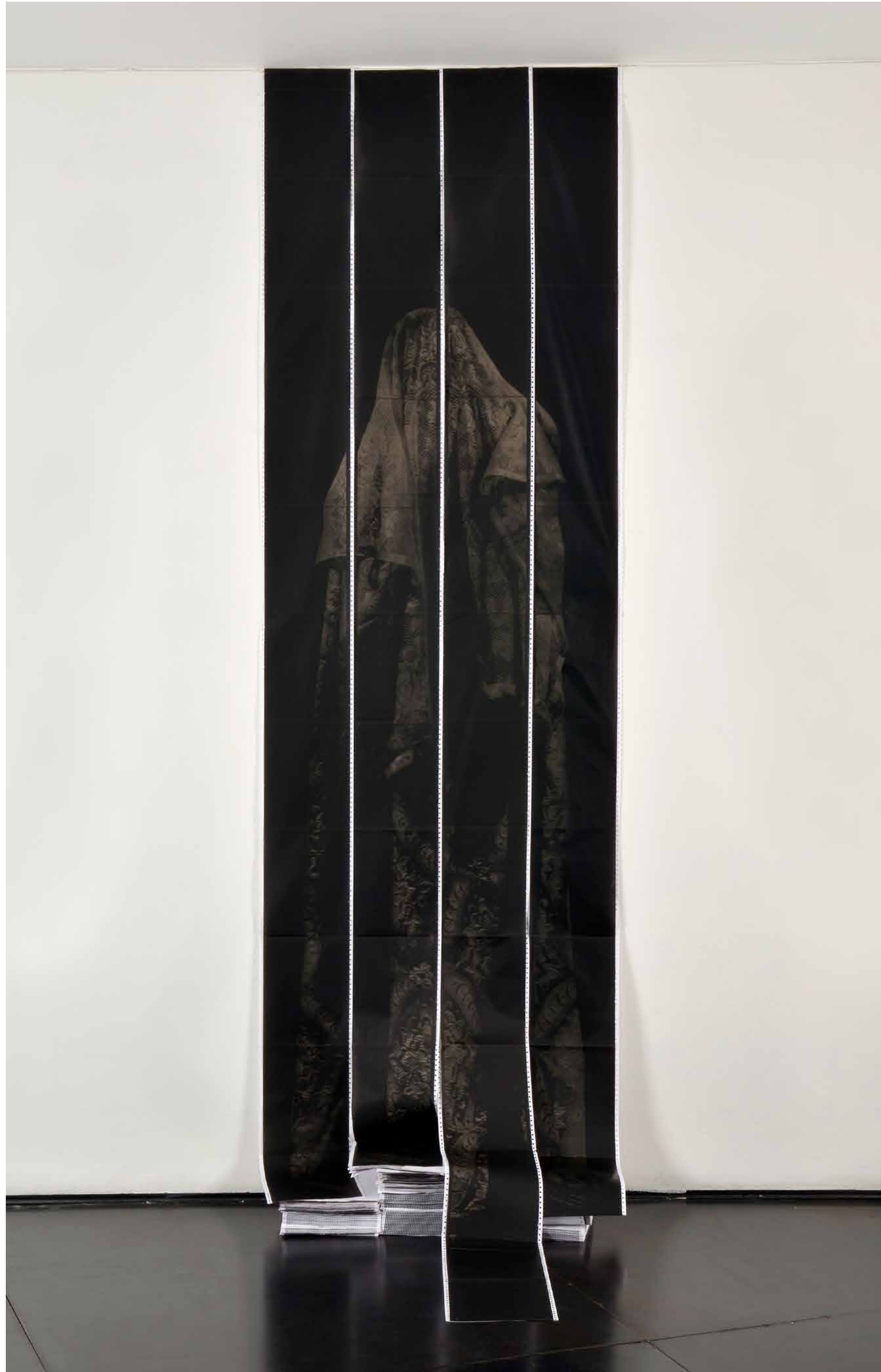
Mal de Archivo, Charcoal printed paper 320 X 93 cm Edition of 5 + 1 AP 2016