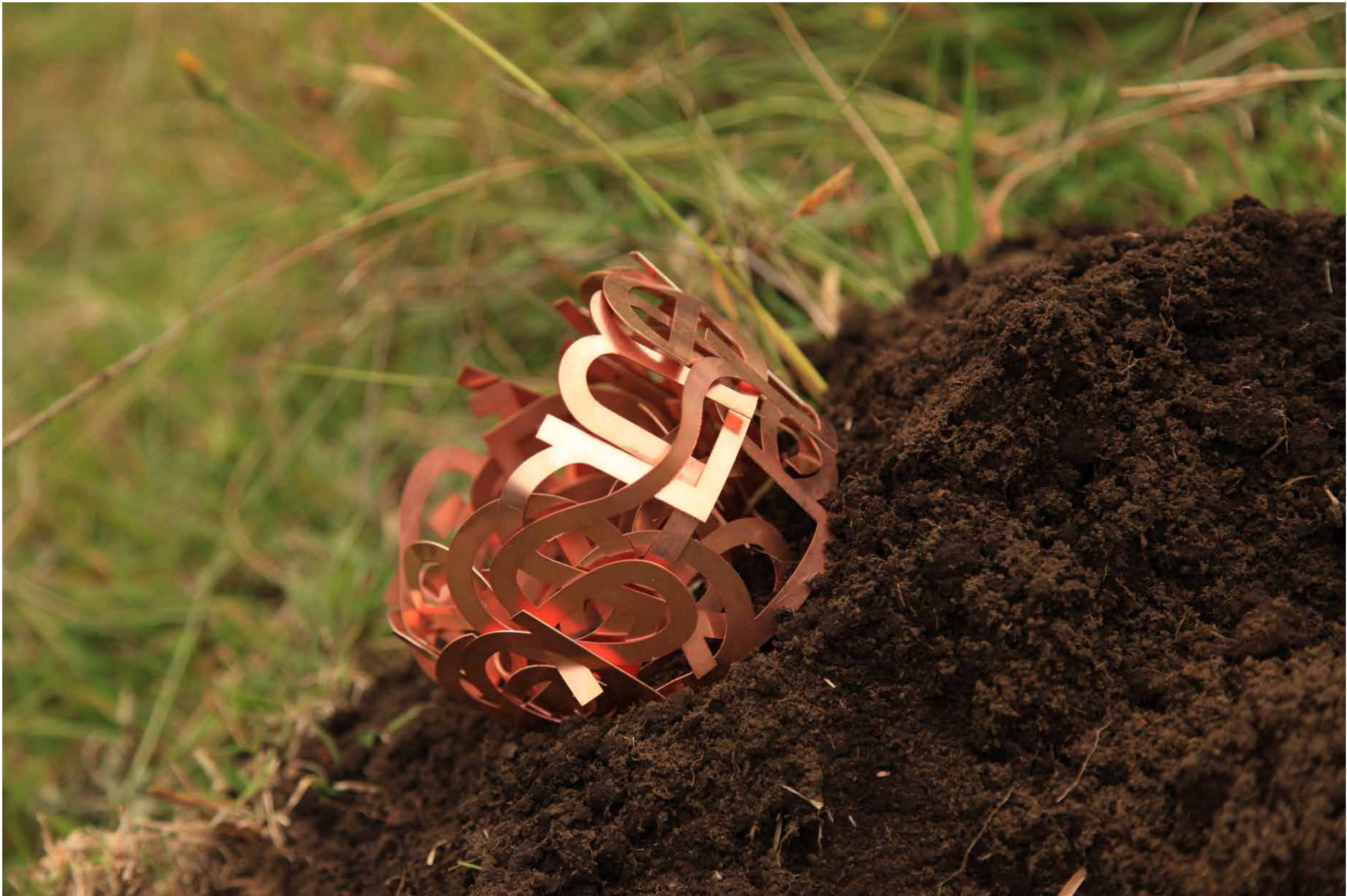
Untitled Cuttet copper Variable dimensions 2022